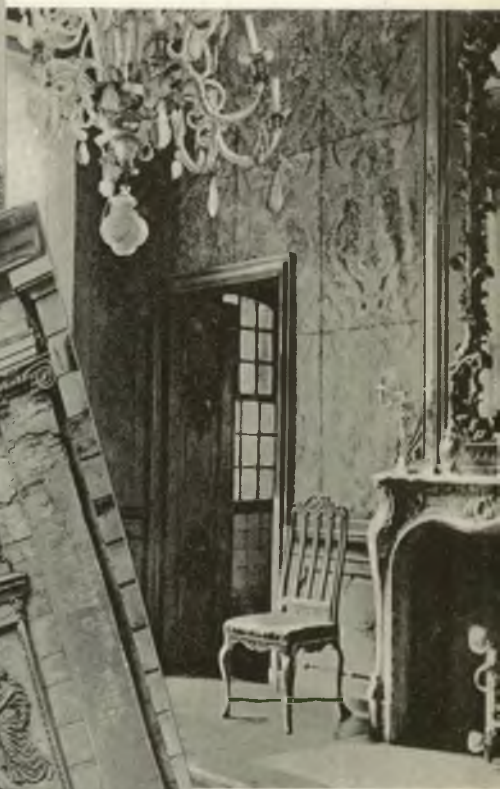
Intérieur de la Maison d'Ansembourg.