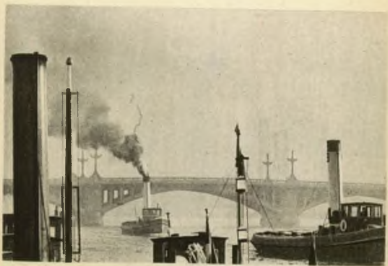
L'avant-port de Liège.