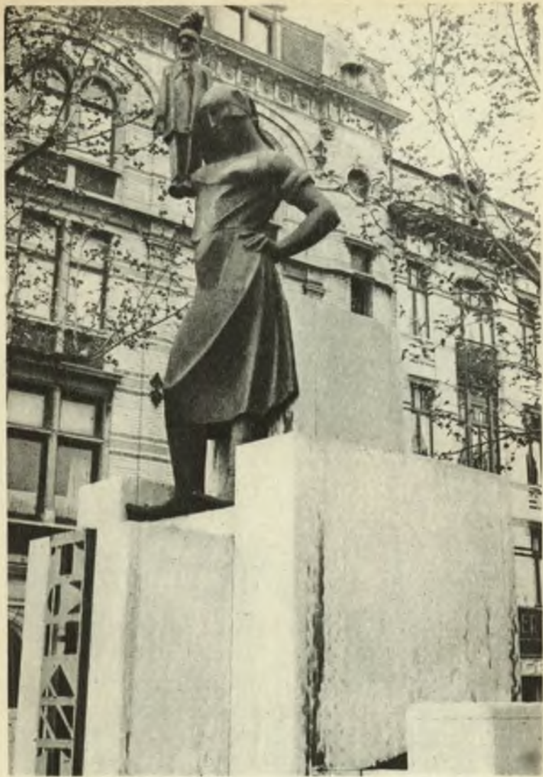
Monument « Tchantchès ».