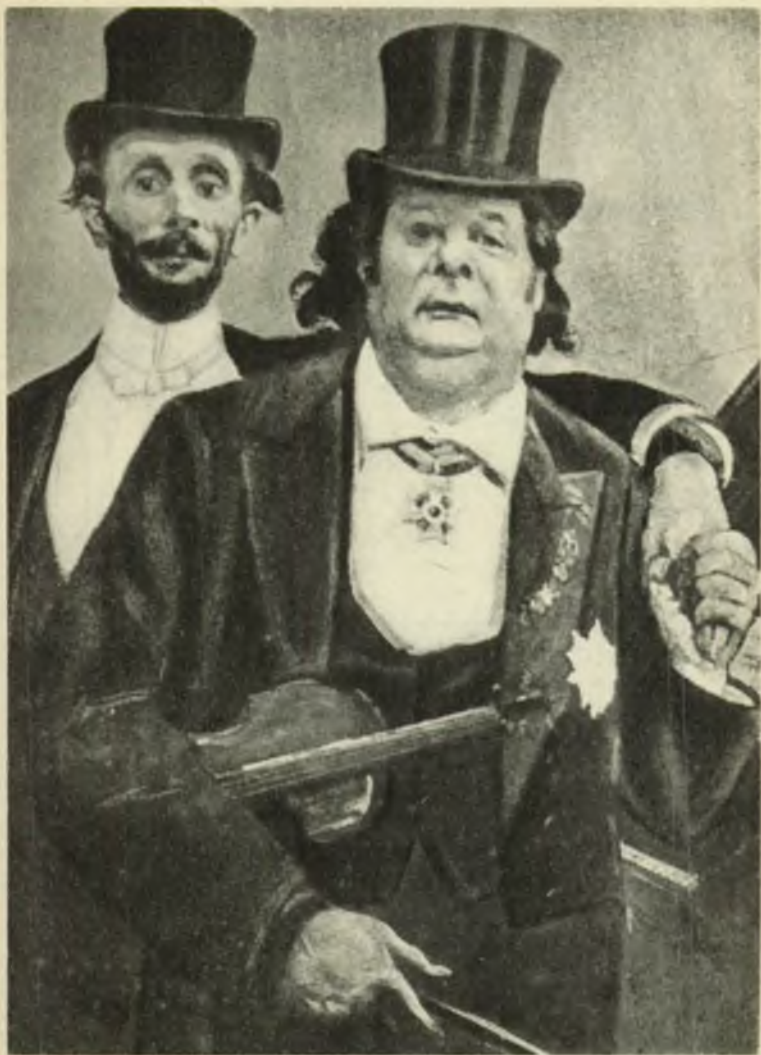
Le pianiste Théo Ysaÿe et le violoniste Eugène Ysaÿe, d'après une œuvre du peintre Henry Lemaire.

Un « Festival des deux Ysaÿe » figurera le mercredi 3 juillet, à 20 heures, dans les programmes de la Radio Catholique Belge.