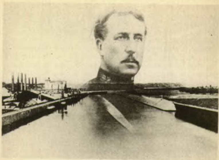
Le canal Albert.