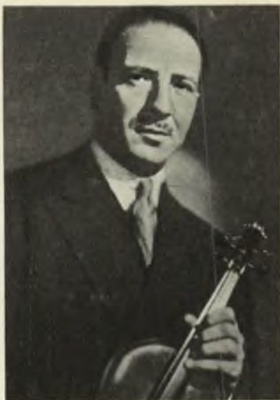
M. Jacques Thibaud.

avec le concours de M. Jacques THIBAUD, violoniste