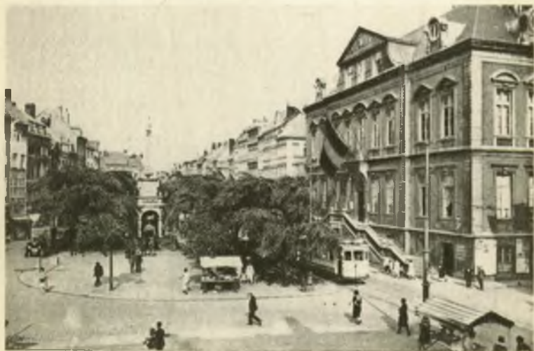
L'Hotel de ville et la Place du Marche.