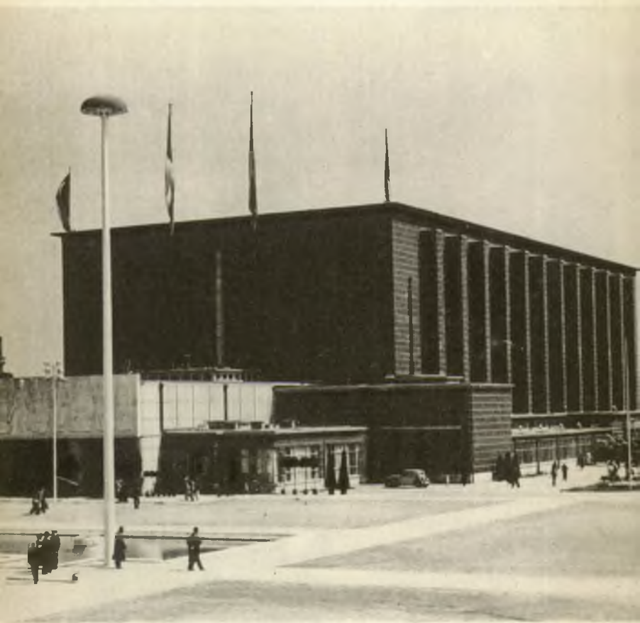
Palais des Fêtes de la Ville de Liège.