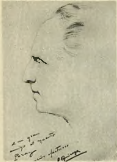
M. Paul Paray.

Sous la direction de M. Paul PARAY, chef d'orchestre des Concerts Colonne de Paris,