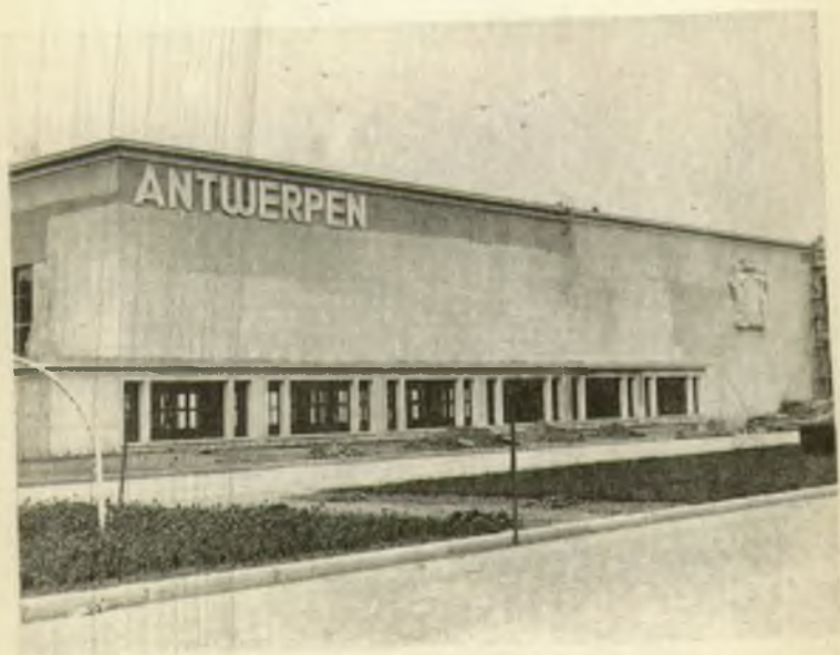
Le pavillon de la ville d'Anvers