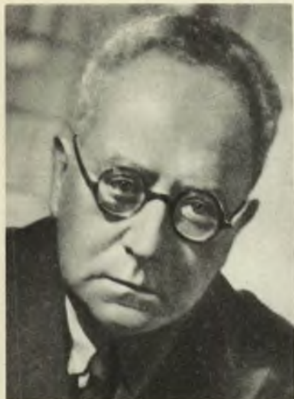
M. Carl Flesch.