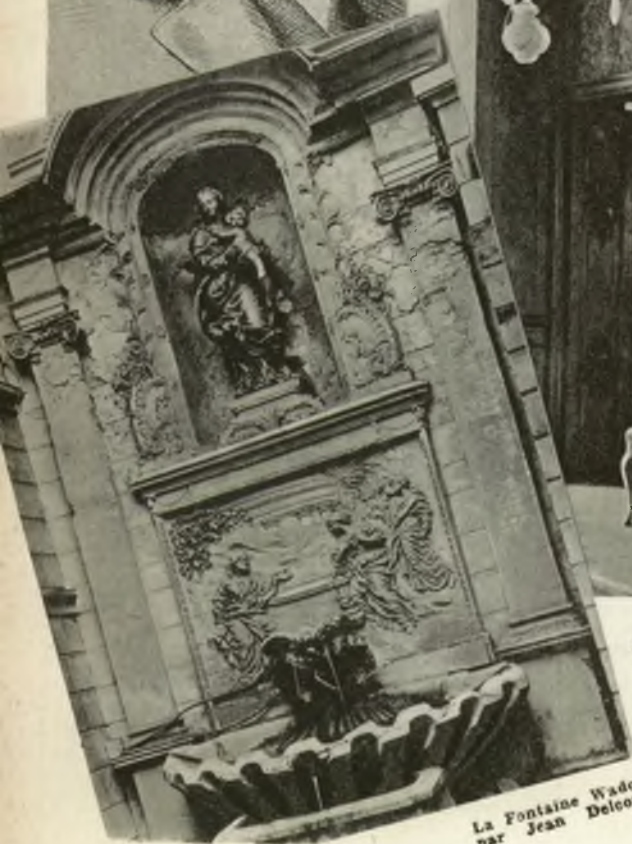
La Fontaine Wadoz, par Jean Delcour.