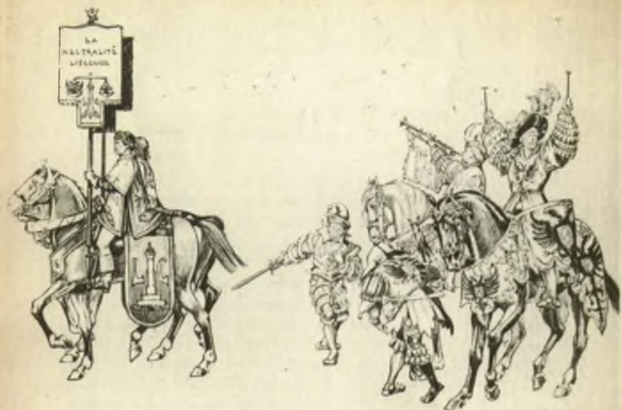
Deux groupes du cortège historique «Jeu de Lignes».