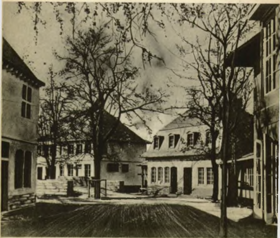
Le Gay Village Mosan.