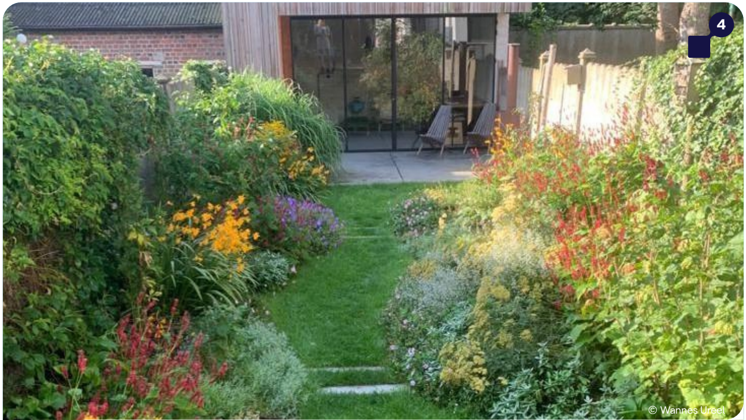
Biodiverse en gemakkelijk te onderhouden stadstuin in Kortrijk https://omgeving.vlaanderen.be/nl/green-deal-natuurlijke-tuinen-008/meer-ontdekken-over-de-green-deal-natuurlijke-tuinen/tuinen-in-de-kijker/onderhoudsvriendelijke-stadstuin