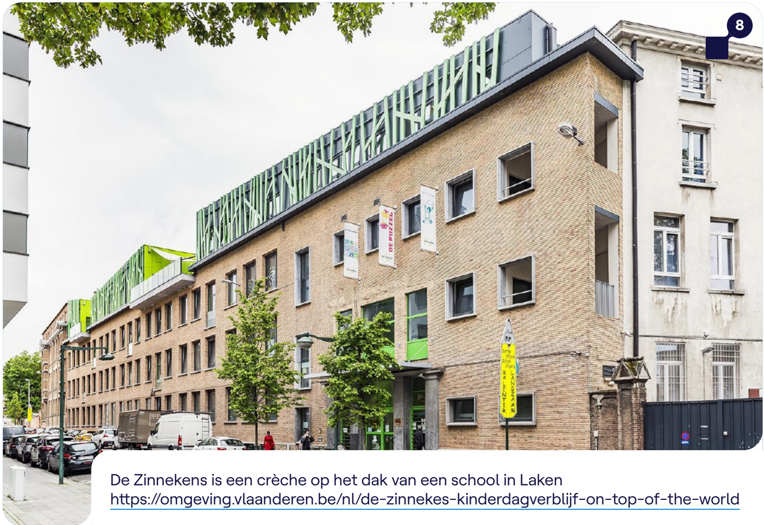
De Zinnekens is een crèche op het dak van een school in Laken https://omgeving.vlaanderen.be/nl/de-zinnekes-kinderdagverblijf-on-top-of-the-world