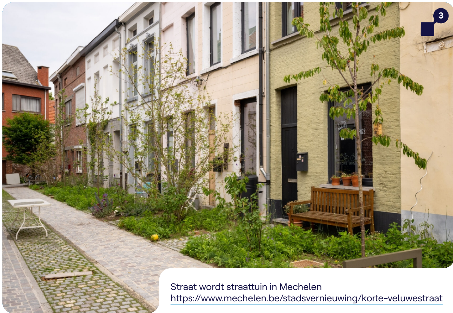
Straat wordt straattuin in Mechelen https://www.mechelen.be/stadsvernieuwing/korte-veluwestraat