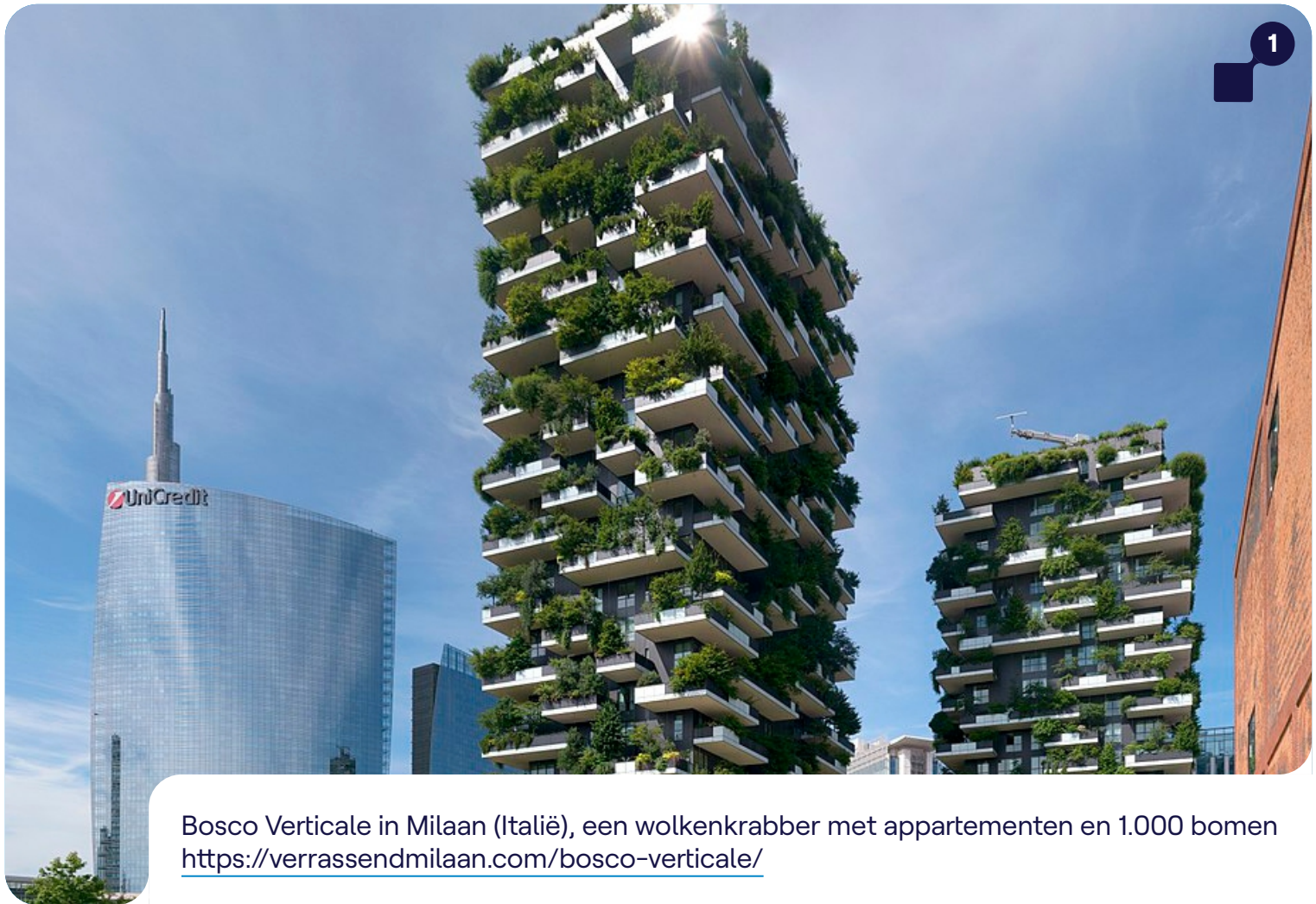
Bosco Verticale in Milaan (Italië), een wolkenkrabber met appartementen en 1.000 bomen https://verrassendmilaan.com/bosco-verticale/